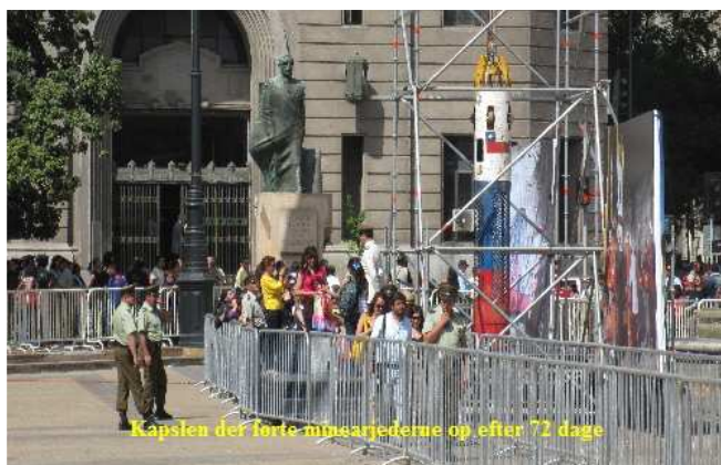
Kapslen der førte minearbejderne op efter 72 dage

Vi besøger Catedral Metropolitana på Plaza des Armes med Moa?statue mm.