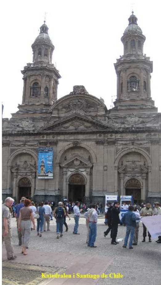
Katedralen i Santiago de Chile

Her i centrum er folk velklædte, bilerne af nyere dato og velholdte. Vi kørte dog også langs et slumkvarter, hvor de lokale ikke kan færdes efter mørkets frembrud pga misbrugsrelateret kriminalitet.